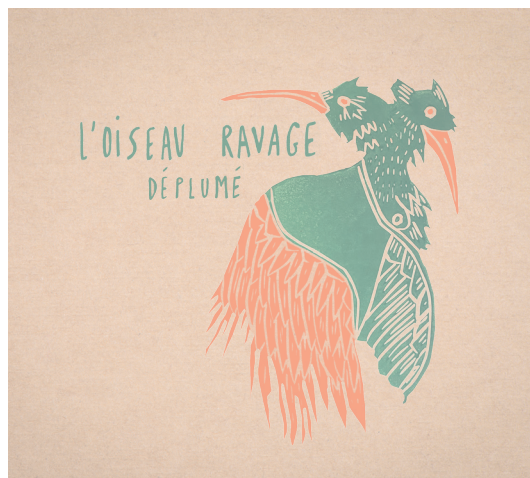
Sortie du premier album «Déplumé» Janvier 2023

Il piaille, glattit, trompète (l'aigle) Il grisoile, tire-lire, turlutte (l'alouette) Il croule (la bécassine) Il miaule, piaule, pieute (la buse) Il cacabe, carcaille, pituite (la caille) Il cancale, caquette, nasilole (le canard) Il chuïnte, hloque, hulule (la chouette) Il gémit, roucoule (la colombe) Il chante, coqueline au point du jour (le coq) Il dodeldire (le coq de bruyère) Il dresse, il siffle, trompette (le cygne) Il gousse, glougloute (le dindon) Il glapit, graille (l'épervier) Il bisote, lase (l'étourneau) Elle zinzinule, babille (la fauvette) Il pleure, il raille (le goéland) Elle pupule, pupute (la huppe) Il jargonne (le jârs) Il babille, bavarde, flûte (le merle) Elle titine (la mésange) Il picasse, peupeute (le pic vert) Il frigotte, ramage (le pinson) Il trille (le rossignol)